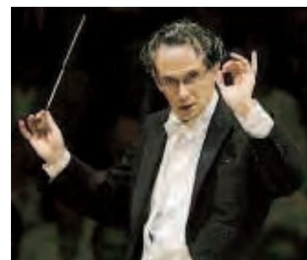
Il maestro Fabio Luisi